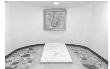
Tombe de Jean-Paul II

En ce qui concerne les funérailles, je donne les mêmes dispositions que celles déjà données par le Pape Paul VI. (Note en marge: la sépulture en terre et non dans un sarcophage 13.3.92).