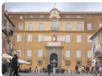
Castel Gandolfo lieu de l'audience avec Benoît XVI

Une spéciale bénédiction apostolique à toute la famille bénédictine - Pendant que j'invoque l'abondance des dons célestes pour soutenir toutes vos généreuses propositions, je donne de tout cœur, à vous et à toute la famille bénédictine, une spéciale bénédiction apostolique.