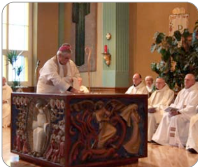
L'évêque oint l'autel