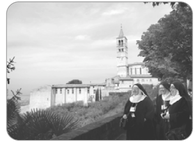
Mère Abbessse et ses compagnes à Assise

En partant pour ce pèlerinage, Mère abbesse et ses compagnes ont apporté toutes vos intentions pour les présenter à Dieu dans ce haut lieu de la chrétienté qu'est Rome. Elles ont prié pour vous dans la Basilique Saint-Pierre et les autres basiliques romaines, en particulier à Sainte-Marie-Majeure qu'elles ont visitée avec dévotion en ce mois de Marie.